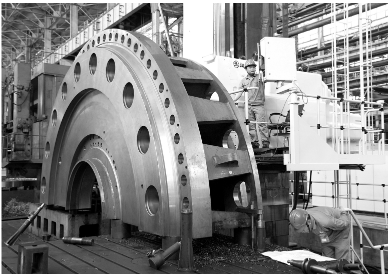
哈电集团哈尔滨电机厂有限责任公司是我国生产大、中型发电设备的重点骨干企业，创造了多个“中国第一”。图为2019年9月3日，工人在大型数控镗床上加工水轮机顶盖

这是稳固国内大循环主体地位、增强在国际大循环中带动能力的迫切需要。制造业是我国经济命脉所系，是立国之本、强国之基。这次抗击新冠肺炎疫情，我国完备的制造业体系发挥了至关重要的支撑作用，再次证明制造业对国家特别是大国发展和安全的重要意义。构建新发展格局，