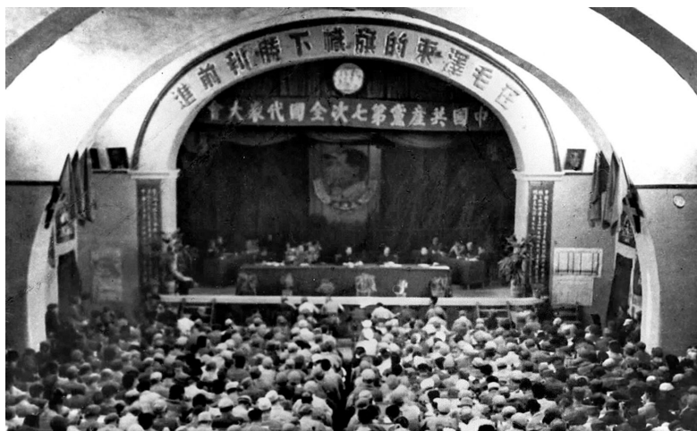
1945年4月23日至6月11日，中共七大在延安举行。大会确立了毛泽东思想在全党的指导地位

以毛泽东同志为主要代表的中国共产党人把马克思列宁主义基本原理同中国革命具体实践结合起来，创立了毛泽东思想，完成了新民主主义革命，建立了中华人民共和国，确立了社会主义基本制度，发展了社会主义的经济、政治和文化。