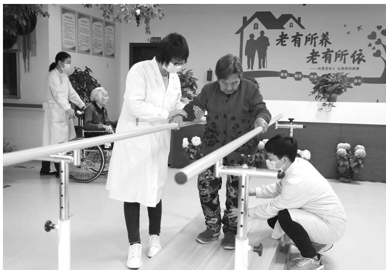
近年来，河北省邢台市积极推进“医养结合”新型养老模式，打造集养老护理、医疗康复于一体的医养中心，增强养老医疗服务能力，满足社会多层次的养老需求

如期全面建成小康社会，我们更加有理由坚信，梦想不是可望而不可即的，全面建成小康社会已经奠定了坚实基础，积累了宝贵经验，积蓄了前行力量，我