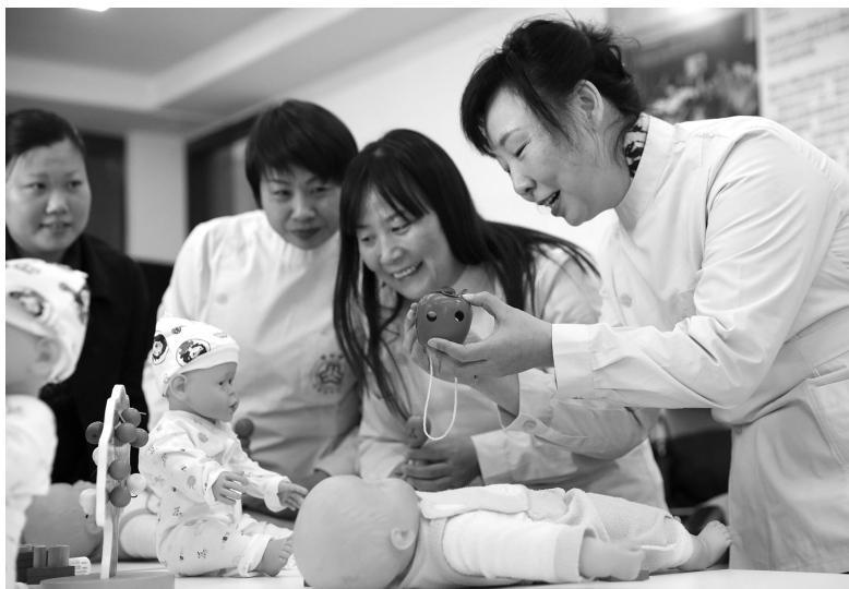
2019年1月16日，在河北省石家庄市桥西区妇女就业培训中心，学员在接受育婴培训，备战节日家政市场

当前和今后一个时期，制约我国经济发展的因素，供给和需求两侧都有，但主要在供给侧，供给结构不能适应需求结构变化，产品和服务的品种、质量难以满足多层次、多样化市场需求。以家政服务为例，从需求方面看，全国 18.2% 的家庭有未成年人照料需求，35.6% 的家庭有老年人照料需求，30.4% 的家庭有双重照料需求；从供给方面看，家政服务人员超过 2800 万人，市场总规模连续保持 20% 左右增速，预计 2021 年将达万亿元规模，但“不规范”“找不到”“不满意”问题依然突出。解决这样的结构性问题，需要从供给侧发力，把改善供给侧结构作为主攻方向。供给侧结构性改革说到底，就是要使我国