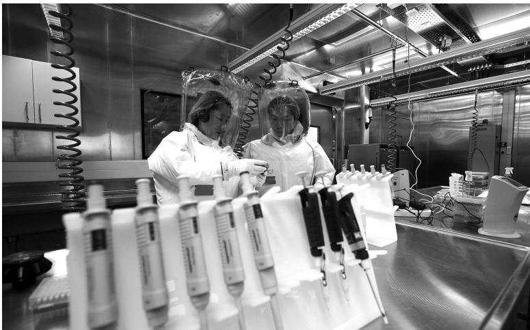
2015年，我国建成首个P4实验室，标志着我国拥有了研究和利用烈性病原体的硬件条件。图为科研人员在P4实验室内进行各项适应性试验演练

科研方式日益革新、效率提升。随着科学研究向超宏观、超微观和极端方向发展，重大理论发现和科学突破越来越依赖先进的实验装备和重大科技基础设施。美国的哈勃望远镜、大型强子对撞机、“中国天眼”、P4（生物安全四级）实验室……一批具有世界先进水平的重大科技基础设施，为前沿技术研究提供了有力支撑。此外，化学、生物等依赖传统实验数据的学科，正逐渐开始利用大数据和计算机仿真模拟进行研究。数据驱动的研究方式兴起，极大提高了科研效率。例如，美国麻省理工学院团队利用深度学习模型，几天内就筛选完超过1亿种化合物，