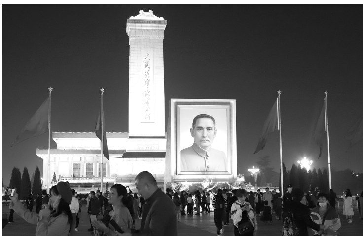
孙中山先生是伟大的民族英雄、伟大的爱国主义者、中国民主革命的伟大先驱，是两岸同属一中的政治联结。图为2020年10月1日，北京天安门广场上的孙中山巨幅肖像

企图彻底摆脱两岸同属一中的“宪政架构”。民进党“立法院”党团提议在2022年“九合一”选举中绑定“修宪公投”。绿营“立委”联署提出“迈向国家正常化修宪”案，妄图删除现行规定中有关“国家统一”