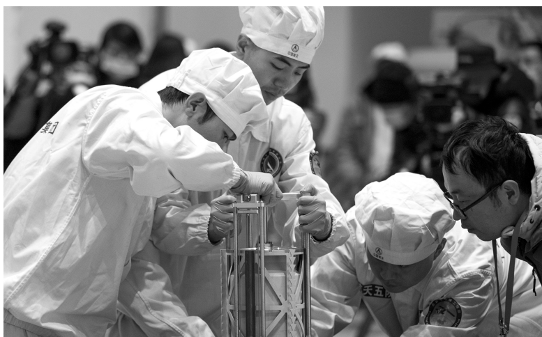
2020年12月17日，在中国航天科技集团五院，科研人员打开嫦娥五号返回器舱门，取出装有月球样品的容器并进行称重

我国科技发展日新月异，载人航天、“神威”超级计算机等一批标志性科技成果诞生，三峡工程、青藏铁路、西气东输等一批重大工程实施完