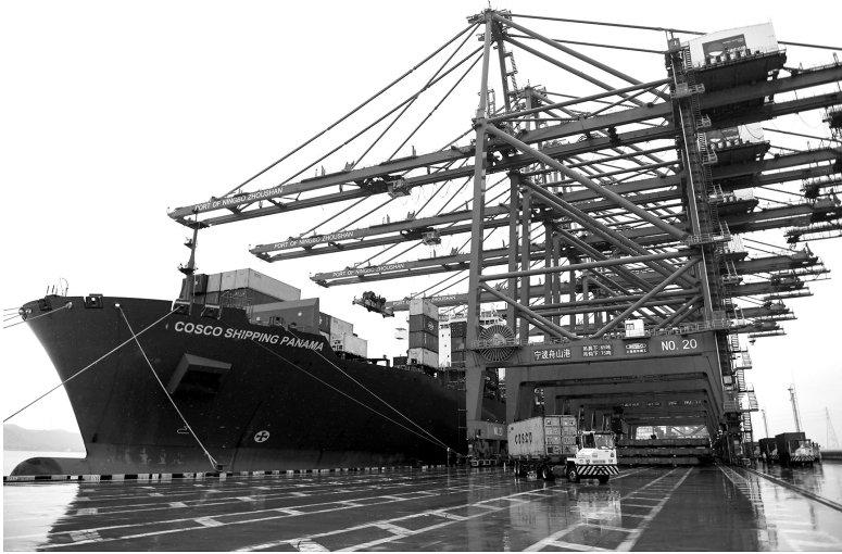
2019年，宁波舟山港成为全球唯一一年货物吞吐量超11亿吨的超级大港，并连续11年位居全球港口第一。图为一艘货轮停靠在宁波舟山港梅山岛国际集装箱码头

构建新发展格局是开放的国内国际双循环，不是封闭的国内单循环。我国经济已经深度融入世界经济，同全球很多国家的产业关联和相互依赖程度都比较高，目前是120多个国家和地区的最大贸易伙伴。国际市场是国内市场的延伸，以国内大循环为主体，绝不是关起门来