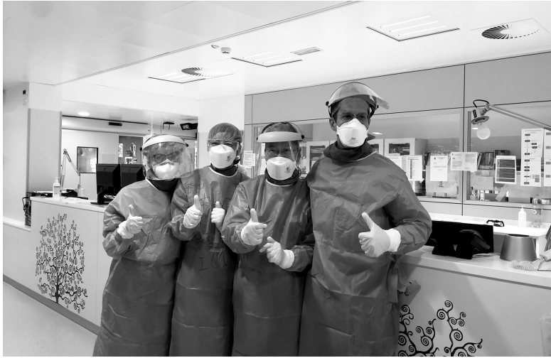
加强国际抗疫合作，是全球应对新冠肺炎疫情的有效途径。 图为2020年3月18日，在意大利帕多瓦，中国抗疫医疗专家组与当地医生合影

立单元的感受，而应该是全人类共同的感受。发展中国家是我国在国际事务中的天然同盟军。对此，习近平主席多次强调，“无论将来中国怎么发展，都永远属于发展中国家，都