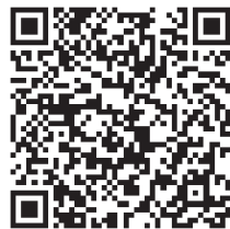
微视频：中央经济工作会议在北京举行

在首位，全面提高公共安全保障能力，促进人民安居乐业、社会安定有序、国家长治久安。要把握好开放和安全的关系，织密织牢开放安全网，越开放越要重视安全，越要统筹好发展和安全，在推动更高水平对外开放、更深度融入全球经济的过程中，着力增强自身竞争能力、开放监管能力、风险防控能力。