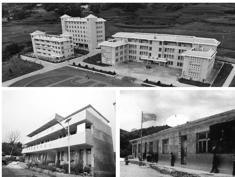
从拼版照片看贵州脱贫之变：上图为贵州省毕节市赫章县河镇彝族苗族乡海雀小学新貌（2018年7月23日摄）；左下图为该废弃的老教学楼（2018年7月23日摄）；右下图为20世纪90年代该校的土坯房教学楼（资料照片）