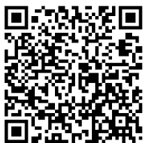
微视频： 中国共产党为什么能

明义地讲到，党不是“知识者所组织的马克思学会”，也不是“少数共产主义者离开群众之空想的革命团体”，而应当是“无产阶级中最有革命精神的广大群众组织起来为无产阶级之利益而奋斗的政党”。著名的三湾改编，开创了“支部建在连上”的制度，在军队内部建起严密的党组织体系，为党全面建设和掌握军队提供了可靠组织