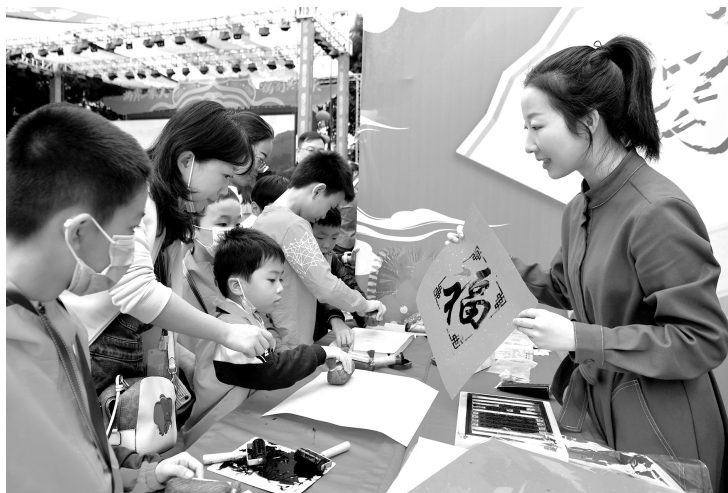
2020年11月21日，“2020两岸青少年木偶传承研学营”活动在福建省福州市正式启动。图为两岸青少年在木刻拓印摊位上学习传统拓印技艺

到大陆就学、实习，扩大对台招生规模，完善台湾青年到大陆就读的入学渠道，为台生提供实习岗位，助其对大陆有全面正确的认识和了解。我们加强两岸青年就业创业基地和示范点建设，吸引更多台湾青年