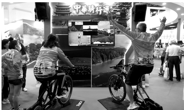
2020 台北夏季旅展举行，两岸展区邀台湾民众“云游”大陆。图为 2020 年 7 月 17 日，台湾民众体验“骑行中华”动感单车

两岸关系和平发展是维护两岸和平、促进两岸共同发展、造福两岸同胞的正确道路。习近平总书记指出，“走和平发展之路，谋互利双赢之道，利在两岸当下，功在民族千秋”。推动两岸关系和平发展，有利于双方增进政治互信，保持良性互动；有利于双方开展协商谈判，加强制度化建设；有利于两岸同胞加强交流合作，加深利益联结，强化精神纽带，增强对命运共同体的认知；有利于两岸减少在国际场合的内耗，减少外来势力干扰，共同维护中华民族整体利益。两岸同胞要从历史中汲取智慧，在现实中认清利弊，共同珍惜和维护来之不易的和平发展成果，坚决反对干扰破坏和平发展的行径。推动两岸关系