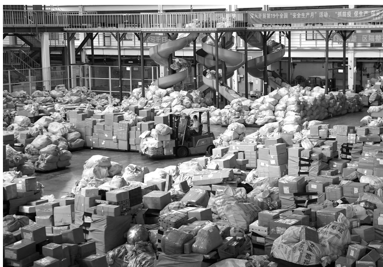
“双 11” 来临之际，中国邮政集团广州航空邮件处理中心一片繁忙景象。图为 2020 年 11 月 10 日，工作人员借助分拣设备加紧作业，保障“双 11”期间物流正常运转

未来一个时期，我国国内市场主导国民经济循环的特征会更加明显，经济增长的内需潜力会不断释放。从需求看，我国已经形成拥有 14 亿人口、4 亿多中等收入群体的全球最大最有潜力市场。仅以 2020