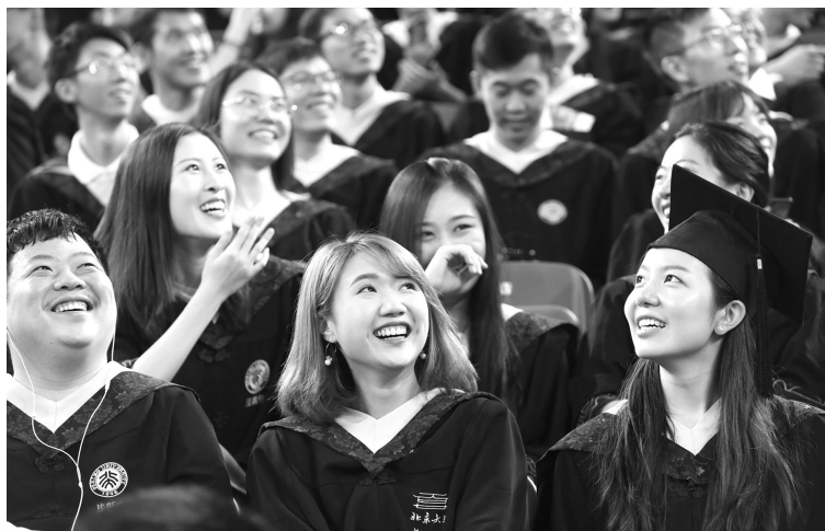
2018年7月10日，北京大学举行2018年本科生毕业典礼。2018年，该校共有3313名学生完成本科培养计划，达到毕业和学位授予要求

从技术辅助手段转变为交织交融，从简单结合物理变化转变为发生化学反应。也就是说，把线上线下教育的深度融合变成一种真正的教学理念、教学方法、教学技术、教学方式、教学模式的变革，这是真