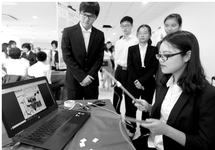
2018年8月8日，上海交通大学密西根学院举办“2018年夏季设计展”。图为参展学生在展示可进行虚拟演奏的“空气鼓”

伟大复兴基础工程的教育强国，医学教育的定位可以概括为三个“大”：大国计、大民生、大学科。加强新医科建设，一是理念新，实现从治疗为主到生命全周期、健康全过程的全覆盖；二是背景新，以人工智能、大数据为代表的新一轮科技革命和产业变革扑面而来；三是专业新，医工理文融通，对原有医学专业提出新要求，发展精准医学、转化医学、智能医学等医学新专业。