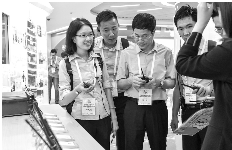
2018年6月26日，香港青年参访深圳，共话粤港澳大湾区发展机遇。 图为香港青年代表在深圳海能达通信股份有限公司总部展厅参观

台同胞规模越来越大，一些人反映，使用往来内地（大陆）通行证在办理网上购票、自助取票、旅馆住宿、金融业务等方面存在诸多不便。为此，2018年8月19日，国务院办公厅印发《港澳台居民居住