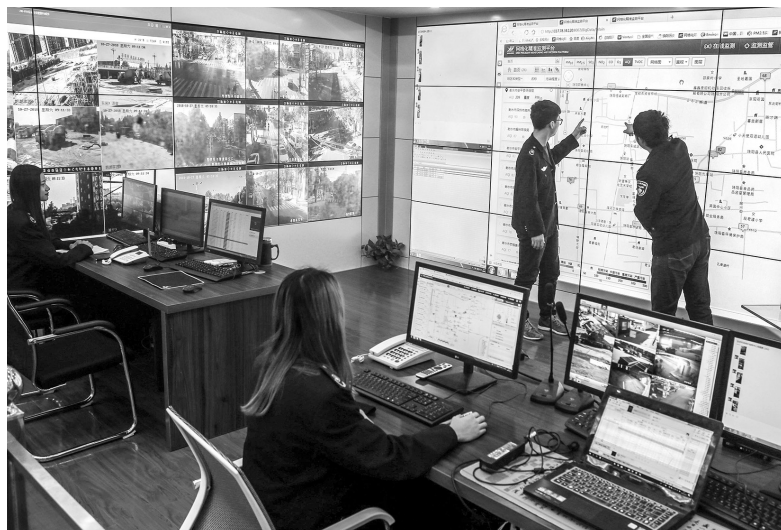
为进一步加大大气污染防治力度，河北省饶阳县于 2018 年成立衡水市首家生态环境保护指挥中心，在全县范围内建设立体化监控指挥网络，为全县生态环境保护工作细致化、科学化开展提供保障。图为该县生态环境保护指挥中心工作人员通过监控平台观察县城污染指数

我国区域生产力布局与自然资源禀赋反差巨大。京津冀及周边 6 省市国土面积占全国的 7.2%，生产了全国 43% 的钢铁、45% 的焦炭、31% 的平板玻璃、22% 的电解铝，原油加工量占全国的 28%，环境压力持续加大。同时，我国经济与环境的地域梯度特征明显，东部地区总体进入工业化后期，环境治理水平较高，这些城市一般生态环境比较优良，自然景观比较丰富，沿海城市有更好的环