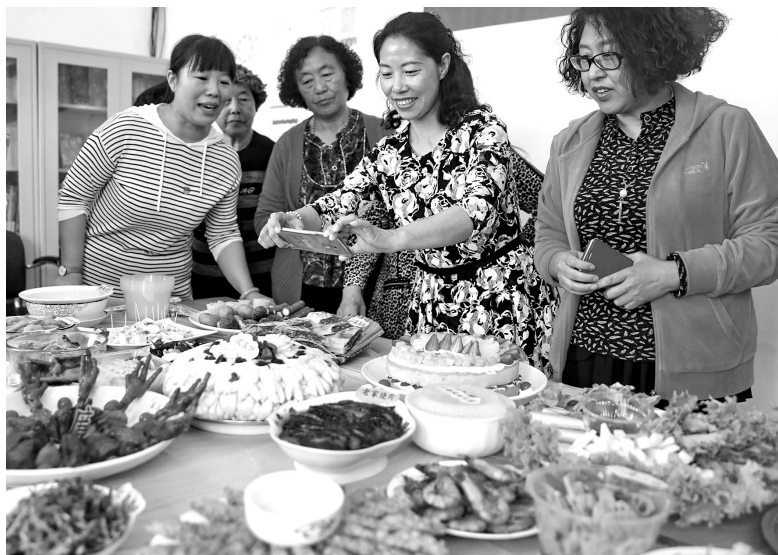
2018年5月8日，河北省秦皇岛市海港区白塔岭街道世纪海洋花园开展“廉洁家风菜 幸福百家宴”活动。社区居民发挥想象，用巧手做出一道道寓意廉洁的风味菜肴，把廉洁情怀润物细无声地融入生活

一方面，党员干部作风明显好转，党风政风为之一新。如今，党员干部以权谋私少了、秉公办事多了，吃喝应酬少了、读书干事多了，铺张浪费少了、勤俭节约多了，群众“上访”少了、领导“下访”多了。另一方面，社会上奢靡浪费现象明显减少，崇廉尚俭、简约质朴正在成为社会新风尚。如今，越来越多的高端餐饮逐渐走向大众化，高档礼品不再走俏，红白喜事不再讲求排场，民间扭曲变味的人情消费开始“刹车”。河北省石家庄市裕华路上，“百姓大酒店”门庭若市。2014年之前，这里叫“皇宫大酒店”，是当地官商聚会的热门场所，一桌饭菜动辄上万元。“皇宫”退场，“百姓”登台，折射出近年来的风气之变。可以说，中央八项规定在全面从严治党历史进程中写下了浓墨重彩一笔，为我国社会各层面带来了广泛而深刻的影响。