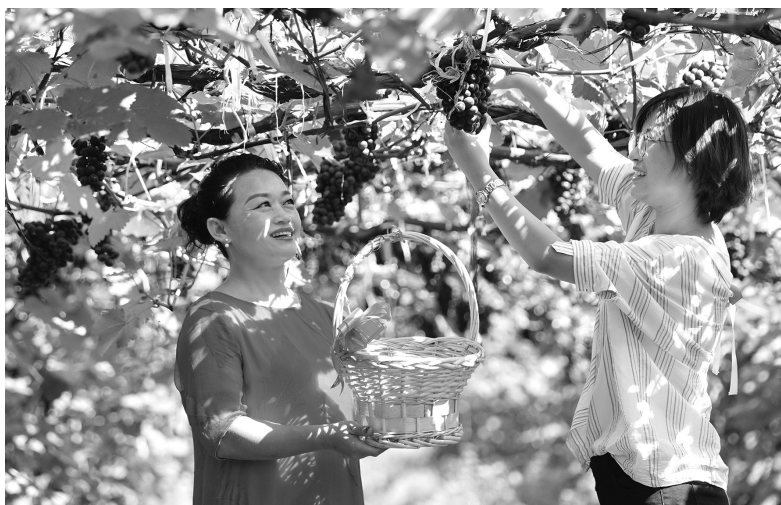
近年来，河北省唐山市丰润区因地制宜推进休闲农业和乡村旅游发展，建设 30 余个生态农旅观光项目，为乡村振兴注入活力

浙江省湖州市是习近平总书记“绿水青山就是金山银山”理念的诞生地。十多年来，湖州市依托绿水青山发展生态农业、乡村旅游，让绿水青山流金淌银、强村富民，成为全国第二个基本实现农业现代化的地级市，生动诠释了“绿水青山就是金山银山”理念。湖州市大