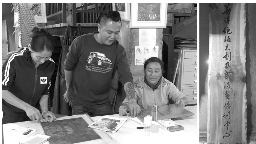
云南省普洱市将帮助农民脱贫与技能培训结合起来。图为当地农民在绝版木刻版画培训中心学习

源远流长的中华农耕文明，为世界留下了丰富多彩的乡土文化遗产。目前，联合国粮农组织公布的31项“全球重要农业遗产”名录中，中国就占了11项，并且这11项遗产至今都还在农业生产中传承。习近平总书记强调，要让有形的乡村文化留得住，让活态的乡土文化传下去。