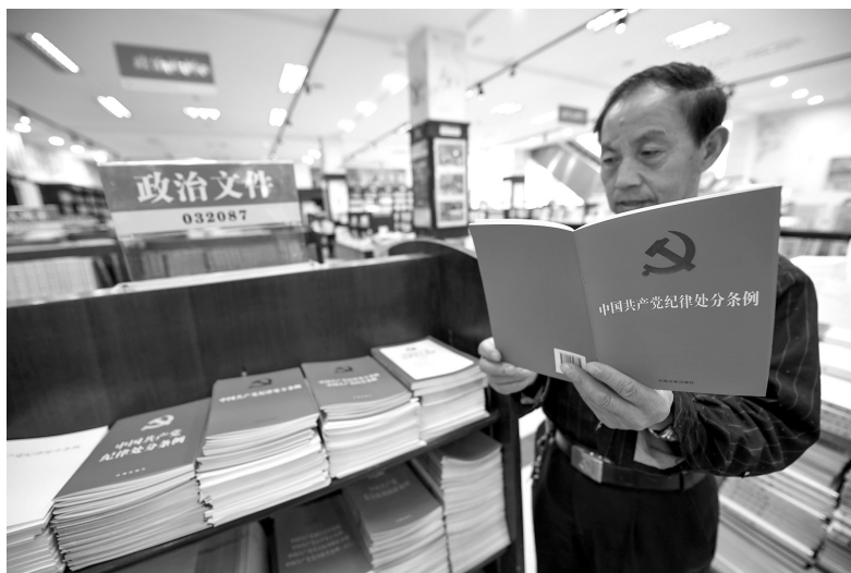
2018年9月20日，新修订的《中国共产党纪律处分条例》在新华书店上架发售

进入21世纪后，党中央对纪律建设的重视一以贯之。2003年12月，《中国共产党纪律处分条例》印发，这是在1997年2月党中央颁布的《中国共产党纪律处分条例（试行）》的基础上修订完善的，它在维护党的章程和其他党内法规，严肃党的纪律等方面发挥了重要作用。2007年10月，党的十七大强调，全党同志要坚决维护党的集中统一，自觉遵守党的政治纪律，始终同党中央保持一致，坚决维护中央权威，切实保证政令畅通。2009年9月，党的十七届四中全会强调，全党要“严守党的纪律特别是政治纪律，保证中央政令畅通”。