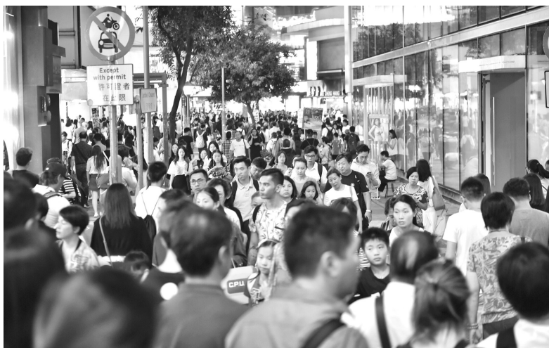
香港旅游发展局公布的数据显示，2018年上半年内地访港旅客超过3060万人次，创2003年以来新高。图为在香港铜锣湾商业区，内地游客络绎不绝

第三，支持香港巩固和提升竞争优势。一是支持香港国际金融、贸易、航运中心发展。支持香港开展个人人民币业务、发行人民币债券、开展跨境贸易人民币结算试点等，奠定了香港人民币离岸市场的先发优势。继续鼓励内地企业在香港上市融资，并推出其他支持香港金融业发展的措施。中央政府在编制相关规划时，均考虑了巩固和发展香港国际航运中心的需要。二是支持香港旅游、零售业及内地港资企业发展。中央政府应香港特别行政区政府请求，逐步扩大“个人游”试点城市。据测算，仅2012年“个人游”就为香港带来相当于本地生产总值1.3%的增加值。三是允许香港居民在内地开办个体工商户，积极支持和帮助内地港资企业转型升级。