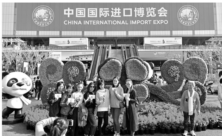
2018 年 11 月 5 日至 10 日，首届中国国际进口博览会在上海举行，吸引了 172 个国家、地区和国际组织，3600 多家企业参展

国国际进口博览会在上海成功举行，吸引了 172 个国家、地区和国际组织，3600 多家企业参展，40 多万名境内外采购商到会洽谈采购，成交额达 578 亿美元。4500 多名各界知名人士出席虹桥国际经贸论坛。中国用行动证明了支持贸易自由化、主动向世界开放市场的决心。未来，中国将继续大幅放宽市场准入，加强知识产权保护，主动扩大进口。中国发布了外商投资准入新的负面清单，在金融、汽车、飞机、船舶等领域进一步开放。根据世界银行的报告，中国营商环境排名比 2017 年提升 30 多位，成为营商环境改善幅度最大的经济体之一。