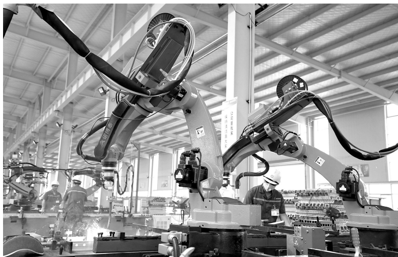
投产不久的金阳（安徽）环保科技股份有限公司位于合肥循环经济示范园，是一家生产建筑用铝模板的大型制造企业。工厂采用全自动化的生产工艺流程和标准化生产及管理体系，不断提升自主创新能力。图为公司员工正在铝模板智能机器人生产线上进行技术操控

地区经济实力显著增强，工业拉动作用明显。自中部崛起战略实施以来，中部地区经济迅速发展，按不变价格计算，2017年地区生产总值相对于2006年增长了2.1倍，年均增速为10.8%。其中，工业增加值年均增长12.5%，比地区