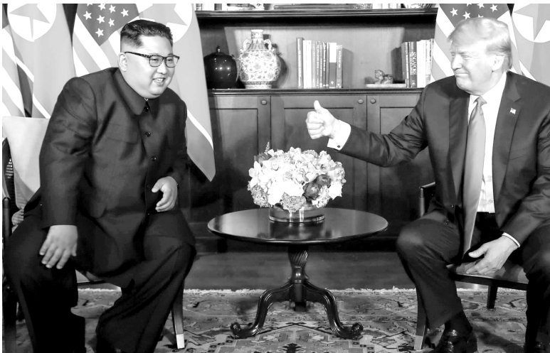
2018年6月12日，朝鲜最高领导人金正恩（左）与美国总统特朗普在新加坡举行会晤

一是朝核问题。2018年韩国平昌冬奥会以来，朝鲜半岛南北关系出现了缓和。朝鲜半岛南北领导人举行会晤，金正恩三度访华，特朗普与金正恩在新加坡也举行了会谈，这是在任的朝美领导人数十年来首次会晤。此次会晤形成了美朝联合声明，美方承诺向朝方提供安全保障，朝方重申对半岛完全无核化的承诺。但是目前的声明是比较模糊的，并没有涉及具体的弃核步骤和时间表。声明的精神能否落实，弃核进程是否出现反复，这些还存在很多的不确定性。而未来各方处理朝核问题的节奏和方式都将事关朝鲜半岛和东北亚未来的总体走势。中国国务委员兼外交部长王毅在金特会后表示：“半岛核问题的核心是安全问题，安全问题的困境最重要的是由美国和朝鲜坐下来通过平等对话来找到解决问题的办法。而为了促进并实现这个进程，近20多年来，中国一直在为之努力。”中国作为半岛近邻和重要一方，愿同有关各方一道，