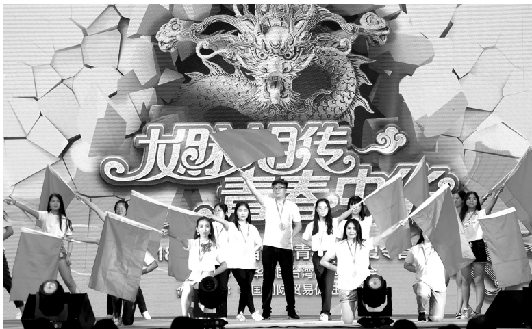
2018年7月10日，台胞青年千人夏令营开幕式在北京举行，近千名来自台湾及海外的台胞青年齐聚北京，共同拉开本届夏令营活动的帷幕

2018年上半年，我们成功举办第十届海峡论坛、2018两岸智能装备制造郑州论坛、戊戌（2018）年清明公祭轩辕黄帝典礼、第二届海峡两岸学生棒球联赛等一系列大型两岸交流活动，推动两岸经济、文化、青年、基层等