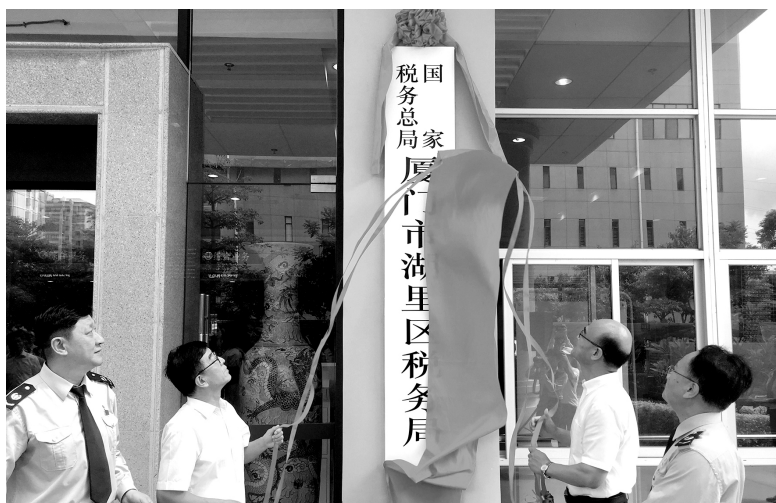
2018年7月5日，新组建的国家税务总局厦门市湖里区税务局挂牌，厦门市国税地税征管体制改革进入纵深阶段

出的改革措施面临着诸多外界因素的干扰和破坏。目光转向国内，改革进行到今天，好啃的骨头基本上都啃完了，剩下的大都是难啃的“硬骨头”。如经济社会发展中不平衡、不协调、不可持续等问题依