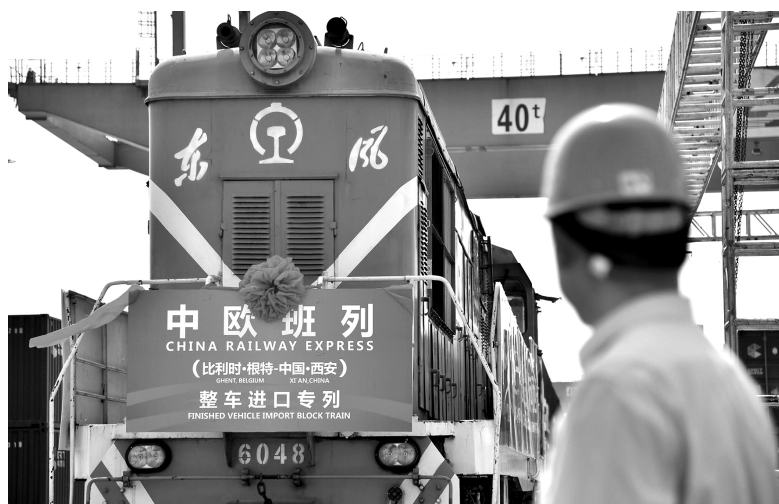
2018年6月13日，首趟中欧班列整车进口专列抵达中国铁路西安局集团有限公司西安新筑车站

第二，我国成为世界贸易大国。新中国成立到改革开放之前的30年里，我国经济基础薄弱，物质生产匮乏，经济建设资金短缺，与世界经济交往的范围狭窄，中国进入了“闭关锁国”状态，国民经济走到了崩溃的