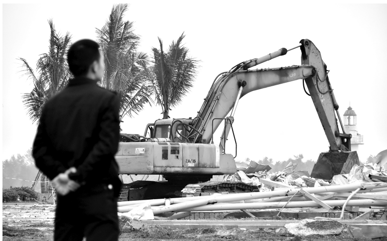
海南省文昌市落实中央环保督察整改，多个围填海项目“双暂停”。图为2018年1月20日，文昌市综合执法局在拆除违规建筑物

集中力量打好污染防治攻坚战，为经济高质量发展拓展空间。为什么要把污染防治称为“攻坚战”？因为