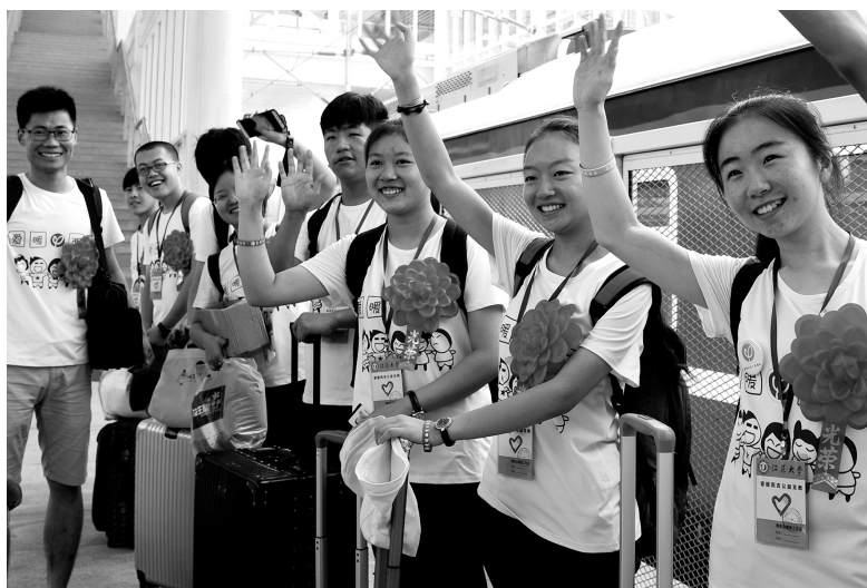
2018年7月10日，江苏大学“爱暖西吉”支教团的大学生志愿者奔赴宁夏，开展为期一个月的暑期公益支教活动

当代青年是同新时代共同前进的一代。实现中国梦，需要依靠青年，也能成就青年。现在高校学生的人生黄金时期，同“两个一百年”奋斗目标