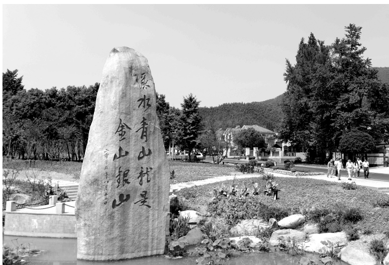
浙江省安吉县天荒坪镇余村是习近平总书记“绿水青山就是金山银山”理论的发源地。图为余村村口的石碑刻着这一重要论断

环境就是民生,青山就是美丽,蓝天也是幸福。必须坚持生态惠民、生态利民、生态为民,重点解决损害群众健康的突出环境问题。加快构筑遵从自然、绿色发展的生态体系,让资源节约、环境友好成为主流的生产生活方式,使青山常在、绿水长流、空气常新,让人民群众在良好生态环境中生产生活,为子孙后代留下可持续发展的“绿色银行”。