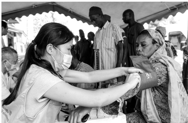
在塞内加尔首都达喀尔，中国援塞医疗队为当地人看诊

发展领域。中方秉持“授人以鱼，更要授人以渔”的理念。近年来，中国在发展领域与非洲的合作主要集中在三个方面：一是加强人才培养，提高非洲自主发展能力。习近平主席在约翰内斯堡峰会上宣布，中方将为非洲援建 5 所文化中心，在非洲 1 万个村落实施收看卫星电视项目；为非洲提供 2000 个学历学位教育名额和 3 万个政府奖学金名额；每年组织 200