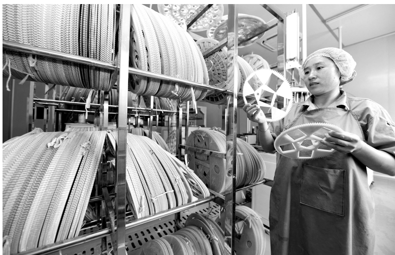
江苏省海安市依靠创新驱动稳增长，通过提升企业创新能力、吸引高端人才团队等措施，促进实体经济高质量发展。图为江苏南通国光光学玻璃公司员工正加紧完成有色光学滤光片加工任务

近年来，我国推出了 1500 多项改革举措，其中，经济体制方面的改革内容堪称“重头戏”，供给侧结构性改革深入推进、发展混合所有制经济、推动商事制度改革、实施负面清单制度、减税降费力度加大……激发了全社会创新创业活力，朝着产权有效激励、要素自由流动、价格反应灵活、竞争