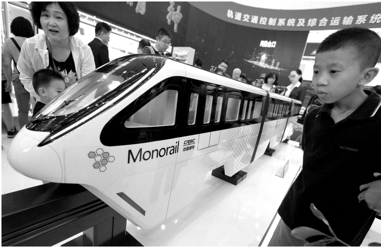
2018年5月19日，在第二届世界智能大会上，中国通号“无人驾驶高铁”的技术第一次公开亮相。目前，已经进入试验阶段

力的较量也日益凸显。1970年，一个美国农民能养活47个人。1971年，美国超过八成的家庭至少拥有一辆汽车。