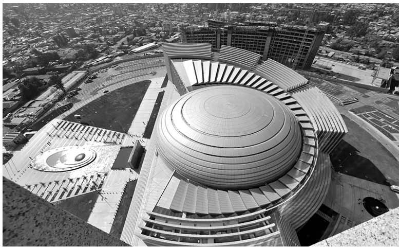
非盟会议中心即非盟总部。主体建筑高99.9米，是埃塞俄比亚首都亚的斯亚贝巴的最高建筑。该工程共耗资2亿美元，由中国政府无偿援建。这也是中国政府继坦赞铁路后对非洲最大的援建项目

方学者也提议，中国各有关涉非事务部委在对非工作上缺乏集中统一领导和足够的沟通，对非洲国家在经济、教育、军事、卫生等方面的互利合作如何有机地结合，缺乏认真的研究和协调，中央有必要制定