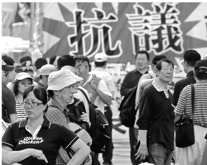
台湾民进党当局以改革之名行清算之实，点燃民怨，引发抗争。图为岛内退休军公教人员抗议民进党当局“年金改革”

民进党弊政频出引发岛内民怨。为追求短期刺激效果、虚造“经济政绩”，民进党当局推出总预算高达 8800 多亿元新台币的“前瞻基础建设计划”，招致广泛质疑。为推行“年金改革”，渲染“世代对立”、挑动社群矛盾。仓促