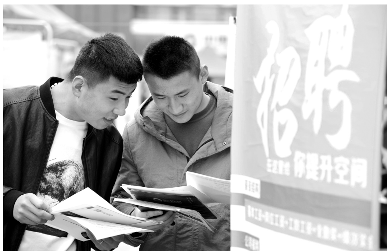
2018年4月4日，退役士兵就业服务月暨“就业起航”专场招聘会在安徽省阜阳市鼓楼广场举行，共有130家用人单位为1500多名退役士兵提供近2600个就业岗位

表”。2018年上半年，我国就业形势向好，市场用工需求旺盛，重点群体就业基本稳定，失业率稳中有降。2018年上半年，我国城镇新增就业752万人，同比增长17万人。全国城镇调查失业率连续3个月低于5%，处于近年来最低位。就业困难人员就业91万人，同比增长2万人。退役军人就业积极推进，钢铁、煤炭去产能职工安置平稳有序。此外，一季度劳动力市场保持活跃，