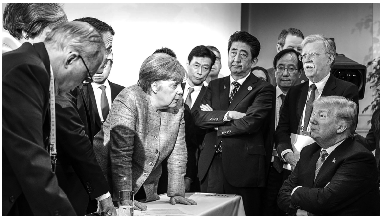
2018 年 6 月 9 日，七国集团峰会在加拿大落幕。美国与加拿大、德国、法国等与会国在关税、气候变化等问题上意见不一。峰会联合公报发表后，美国拒绝承认公报。图为峰会期间，美国总统特朗普成为众多领导人劝说的对象

引发了部分欧盟国家的反对，认为中国在“分裂欧洲”。中欧传统上的矛盾主要集中于贸易和人权问题，延续了将近 30 年的欧洲对华武器禁运还没有解除。在当前的中美贸易战中，同样与美国存在贸易