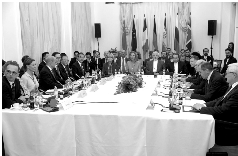
2018年7月6日，伊朗核问题外长会在维也纳发布联合声明，重申各方共同维护执行伊核全面协议不动摇，并致力于解决美国退出伊核协议后出现的问题

然而，伊核协议达成后，以色列和美国鹰派均大为不满，以色列总理内塔尼亚胡多次谴责协议绥靖伊朗，