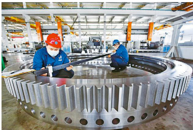
安徽省马鞍山市经开区企业开足马力生产

无接触餐厅等新技术、新业态、新模式快速发展，不仅缓解着疫情造成的冲击，也给中国经济带来新机遇。疫情也极大地影响全球供应链，中国打通“堵点”补上“断点”，畅通产业循环、市场循环、经济循环，保持产业链、供应链的稳定，中国企业有能力为世界作出新的更大贡献，等等。既有基本面作为压舱石，又有各种积极因素叠加助力，中国经济完全有条件、有能力化危为机，赢得发展主动权。