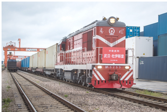
3月28日，中欧班列（武汉）恢复常态化开行

与此同时，对世界贸易来说，近年来，由于主要经济体之间发生诸多经贸摩擦，国际贸易壁垒增多，全球贸易增长出现停滞。随着新冠肺炎疫情在全球蔓延，各国相继采取交通运输管制、限制人口流动等措施，将使全球经贸