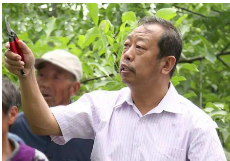
文 | 海军大连舰艇学院