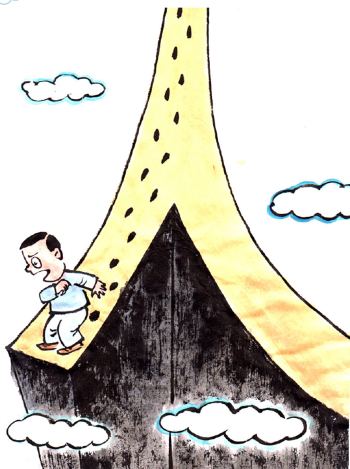
发觉自己走错了方向，停止也是一种正确 刘志永

本栏目欢迎师生踊跃提供优秀原创漫画作品，投稿请发至 shishigz@126.com，获选者可获得稿酬或奖品。