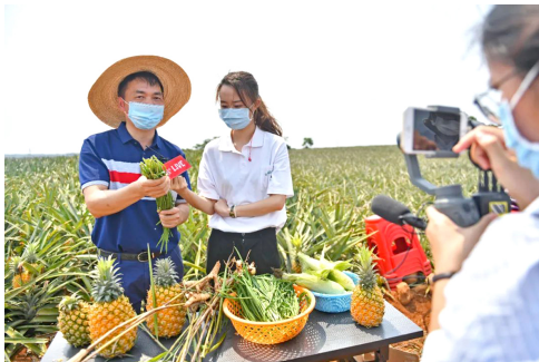
疫情期间，“直播带货”成了农产品热销模式。图为广东徐闻县扶贫工作组直播介绍当地特色农产品

【新闻背景】 4月17日，备受关注的一季度经济数据发布。国家统计局发布的数据显示，2020年第一季度我国国内生产总值（GDP）206504亿元，按可比价格计算，同比下降6.8%。尽管受疫情冲击严重，但是14亿人的基本民生得到了较好保障，经济社会大局稳定，统筹推进疫情防控和经济社会发展成效显著。3月份，主要经济指标呈现回升势头，降幅明显收窄，表明我国经济社会发展大局总体上保持稳定，复工复产加速推进，国民经济复苏明显加快。