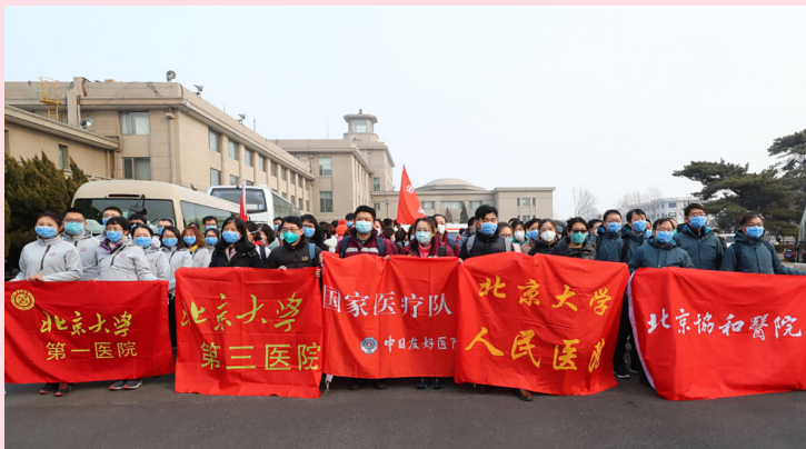
国家援鄂抗疫医疗队队员合影

在这场抗击新冠肺炎疫情的严峻斗争中，各级党组织和广大党员干部冲锋在前、顽强拼搏，充分发挥了战斗堡垒作用和先锋模范作用。其中，青年党员更是在火热实践中不断成长。“‘90后’是被呵护成长的花朵，一直有前辈、老党员为我们遮风挡雨，如今