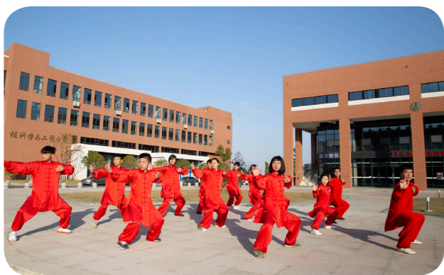
老师带着同学们在明媚的阳光下打太极拳

第四，在体育文化培育上，学校每年定期举办田径运动会，组织团体操、篮球、足球、排球、跳绳、校园吉尼斯等比赛，还积极组织师生参加