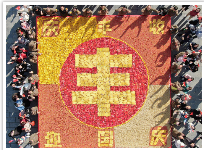
2019年9月23日，河南省洛阳市栾川县民众用当地的猕猴桃、山楂、玉米等绘制了边长为7米的大型丰收图

粮食安全与能源安全、金融安全并称三大经济安全，是国家安全的重要基础。美国战略家、前国务卿基辛格曾经说过，谁控制了粮食，谁就控制了人类。的确，粮食是个特殊产品，每天必须吃，一天三顿不可少，如此重要的战略物资，一旦被卡了脖子，就会造成很大的被动。当前，国内外形势错综复杂，我国经济面临下行压力，部分企业经营运行的风险和困难增多，给就业和基本民生带来较为明显的影响。此时如果粮食生产不稳住，供给出现问题，引起粮食价格上涨，就会使经济发展陷入增长下行和物价上行“双碰头”的被动局面。所以，经济形势越复杂，越要稳住农业基本盘，发挥好“三农”压舱石的作用。老百姓有饭吃、有活干，没有后顾之忧，整个大局就稳定了。