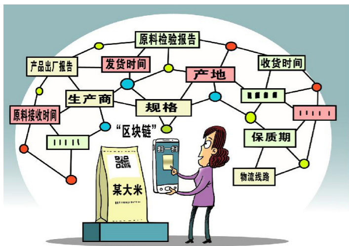
一扫就知 作者 朱慧卿

生产源头。2018年12月，国家数字农业建设试点项目——福建光阳蛋业蛋鸡养殖基地利用物联网、区块链技术，完善“一品一码”追溯体系。从鸡苗开始的成长数据，通过设备采集后均传入云端，为消费者、监管部门和企业管理者提供准确可靠、不可更改的完整闭合数据链和