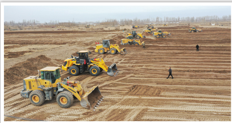
2019年11月25日,高标准农田项目建设在甘肃省张掖市甘州区小满镇全面推行

地承包关系并保持长久不变,按照依法自愿有偿原则,推动土地经营权有序流转,促进承包地适度规模经营,大力培育以家庭农场、农民合作社为主体的新型农业经营主体,发展农业社会化服务体系,推进农业产业化经营,促进小农户和现代农业发展有机衔接,农业经营形式更加丰富和完善。进一步改革完善农业支持保护制度,探索建立生产者补贴,开展耕地地力保护和休耕轮作,健全山水田林湖草等重点农业生态系统的资源管护和补偿机制,逐步形成了与市场经济体制相适应的农业支持保护政策体系,极大解放和发展了农村社会生产力,调动了农民种粮和地方政府抓粮积极性,为粮食生产不断迈上新台阶提供了支撑保障。