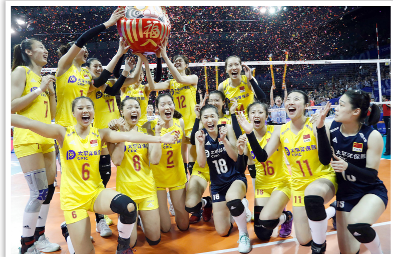
女排精神代表着一个时代的精神,喊出了为中华崛起而拼搏的时代最强音。2019年8月4日,在东京奥运会女排资格赛中,中国女排以小组3战全胜的战绩直接晋级东京奥运会

第四,要积极构筑中国精神、中国价值、中国力量。习近平总书记指出:“人无精神则不立,国无精神则不强。精神是一个民族赖以长久生存的灵魂,唯有精神