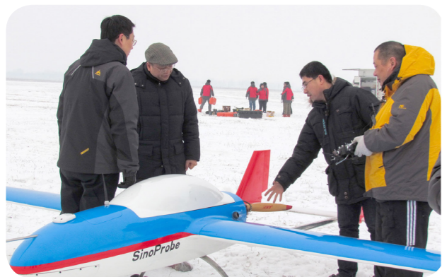
2013年1月20日，黄大年（左二）及团队成员在极寒天气下进行固定翼无人机试飞 许畅/摄

400多名科学家创造了多项“中国第一”，为中国的“巡天探地潜海”填补了多项技术空白，中国“深部探测技术与实验研究”项目5年的成绩超过了过去50年，深部探测能力达到国际一流水平…… 2016年6月28日，黄大年主持的“深部探测关键仪器装备研制与实验项目”达到国际领先水平。可就在前一天，黄大年晕倒在了办公室，醒来后他让秘书瞒住所有人。每当他坚持不下去的时候，就看一看墙上的照片，那是2010年夏天，习近平等党和国家领导人在北戴河与“千人计划”科学家代表的合影。看到这张照片，无穷的力量又在他的心中回升。可人毕竟不是机器，2016年11月29日，黄大年再次晕倒，这一次，他晕倒在飞机上。他醒来后的第一句话就是：“我要是不行了，请把我的电脑交给国家，里面的研究资料很重要！”