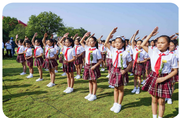
2019年9月30日，广西桂林兴安县各界民众代表在该县红军长征突破湘江烈士纪念碑园开展烈士公祭活动

伟大长征精神在革命英雄的身上得到了充分的体现。而说到革命英雄，我想到了这样一位青年。他是湘江战役中的一位