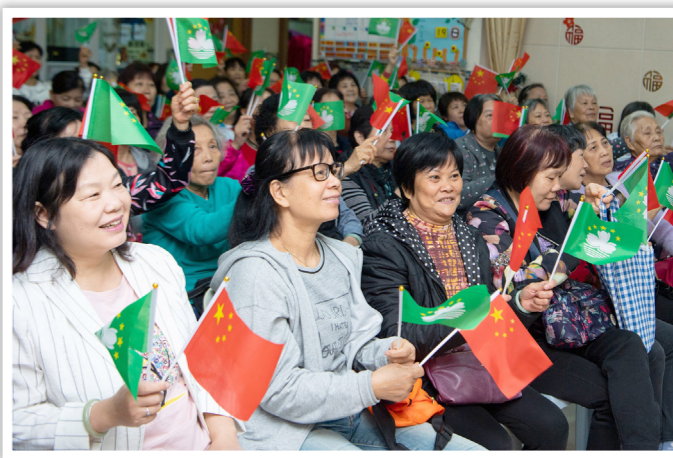
“具有澳门特色的‘一国两制’成功实践”是对新中国成立70周年最好的献礼。图为2019年12月20日，街坊们一起在澳门马黑祐颐康中心收看庆祝澳门回归祖国20周年大会暨澳门特别行政区第五届政府就职典礼的电视直播

实践证明，中国特色社会主义制度和国家治理体系是以马克思主义为指导、植根中国大地、具有深厚中华文化根基、深得人民拥护的制度和治理体系，是具有强大生命力和巨大优越性的制度和治理体系，是能够持续推动拥有近14亿人口大国进步和发展、确保拥有5000多年文明史的中华民族实现“两个一百年”奋斗目标进而实现伟大复兴的制度和治理体系。对此，我们坚信不疑。