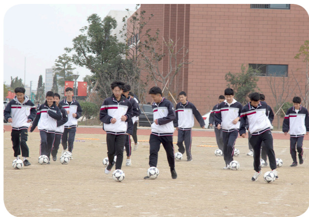
特色足球课上，同学们正在进行带球训练

亚体育场足球场，亲切看望在德国训练的青少年足球运动员，他勉励大家：“我希望你们通过这次来德国培训，在中国青少年足球方面发挥带动作用。也希望更多的青少年投身中国足球事业。我看好你们，看好你们这一代。我希望将来你们能够成为出色的足球运动员。”2016年9月，习近平总书记重回母校北京八一学校。在学校的操场上，习近平总书记看到小足