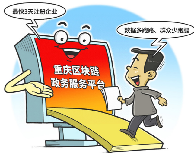
便利 作者 程硕

供应链管理 在工业互联网时代，不管是制造业还是零售业，对于供应链管理的重视性和需求都是直线上升的，商业全球化意味着供应链全球化，全球化的供应链服务需要实现社会化协同。典型的采购和销售供应链阶段包括：生产采购订单、仓库备货、物流运输、收货确认、商品销售环节。基于区块链的供应链协同应用将供应链上各参与方、各环节的数据信息上链，做到实时上链，数据自产生就记录到区块链中，通过数据加密存储保证数据隐私，智能合约控制数据访问权限，做到数据和信息的共享与协同管理。2018年7月，联想集团结合区块链打造可信的供应链管理体系，提出基于区块链的企业协同采购管理方案，使合同制造商、联想、部件供应商可以在联想的区块链平台上进行实时交易数据共享，解决了供应链各方信息不透明、业务流程烦琐以及信息孤岛等问题，实现了供应链各个环节的实时信息共享和多方协同共赢。