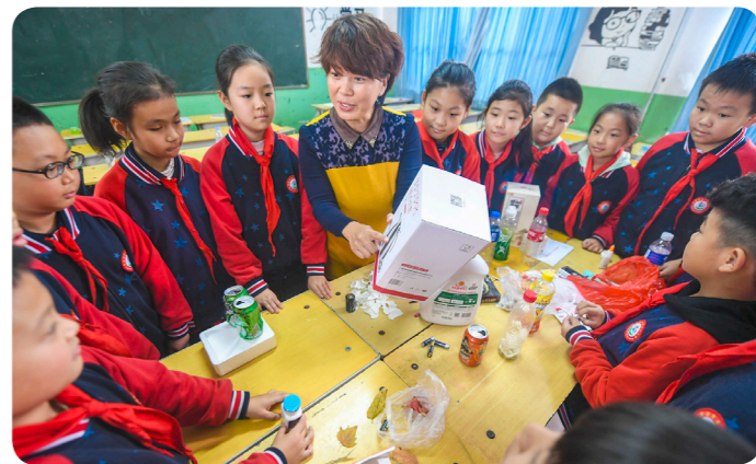
2019年9月以来，河北省廊坊市广阳区在各中小学开设垃圾分类常识课。图为2019年10月18日，廊坊市第十三小学的老师通过道具向学生们介绍垃圾分类常识

最后，垃圾分类还能带来巨大的经济效益。以垃圾焚烧发电为例，北京环卫集团南宫生物质能源有限公司是北京第五座生活垃圾焚烧厂。这个焚烧厂每天能“吃掉”1200吨生活垃圾，“吐出”约35万度电。垃圾分类能改善垃圾品质，提高焚烧热值，幅度为30%~40%，若以0.4元/度上网电价计，盈利将提升15~20元/吨。此外，垃圾分类还催生了新的职业——代收垃圾网约工，顾名思义，就是客户线上预约，收废品小哥上门回收，只要勤快，月收入可达1万元以上。新的市场参与者进入环卫设备制造、厨余垃圾处置等领域，“掘金”垃圾堆，新的蓝海产业正在浮现。