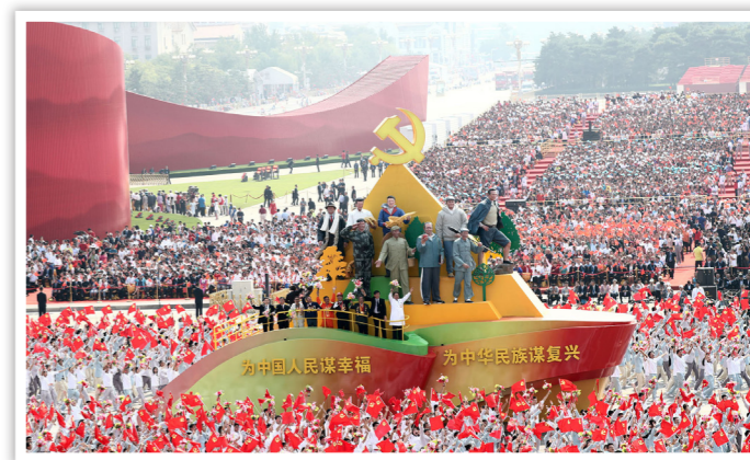
2019年10月1日，庆祝中华人民共和国成立70周年大会在天安门广场隆重举行。图为群众游行中的“不忘初心”方阵

新中国成立70年来，正是因为始终在党的领导下，集中力量办大事，国家统一有效组织各项事业、开展各项工作，才能成功应对一系列重大风险挑战、克服无数艰难险阻，始终沿着正确方向稳步前进。在这个过程中，我们党团结带领亿万人民，不断探索、不断实践，建立和完善社会主义制度，形成和发展党的领导和经济、政治、文化、社会、生态文明、军事、外事等各方面制度，不断完善国家治理，取得历史性成就。党的十八大以来，我们党领导人民统筹推进“五位一体”总体布局、协调推进“四个全面”战