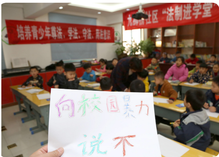
2017年12月3日，安徽省合肥市庐阳区九狮桥社区司法所工作人员走进小学，开展未成年人法律大讲堂，“向校园暴力说不”

学校保护是关键。学校是孩子的第二个家，担负着培养社会主义接班人的重要职责。学校自身首先要