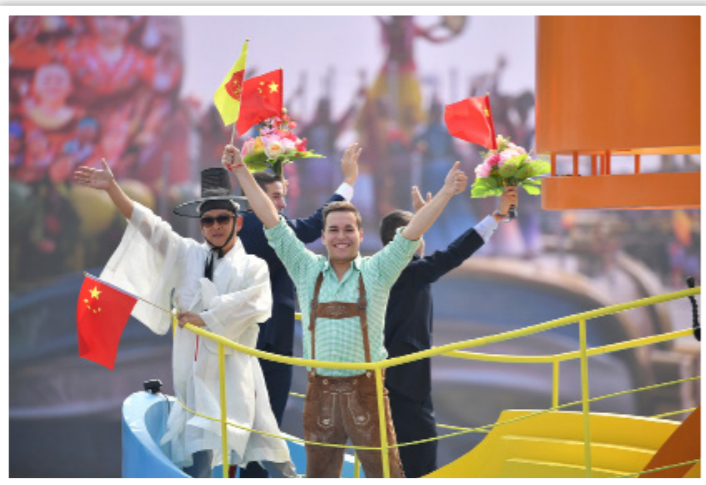
2019年10月1日,庆祝中华人民共和国成立70周年大会在北京天安门广场隆重举行。图为“人类命运共同体”方阵从天安门前经过

从利益相关的“利益共同体”、权责共担的“责任共同体”,向构建命运相连的“命运共同体”方向迈进,超越了民族国家中心范式和非此即彼的对立思维,符合世界各国和各国人民的共同愿望。人类命运共同体理念主张文明只有特色之别,没有优劣之分,强调尊重世界文明多样性,以文明交流超越文明隔阂、文明互鉴超越文明冲突、文明共存超越文明优越,最终实现“各美其美,美人之美,美美与共,天下大同”,符合人类文明发展的基本规律。正如白皮书所写的那样:“推动构建人类命运共同体,不是倡导每个国家必须遵循统一的价值标准,不是推进一种或少数文明的单方主张,也不是谋求在全球范围内建设统一的行为体,更不是一种制度替代另一种制度、一种文明替代另一种文明,而是主张不同社会制度、不同意识形态、不同历史文明、不同发展水平的国家,在国际活动中目标一致、利益共生、权利共享、责任共担,从而促进人类社会整体发展。”