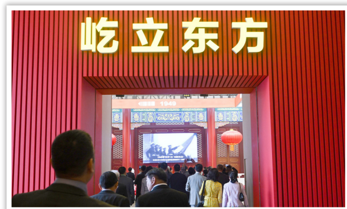
2019年9月28日，部分海外侨胞在北京受邀参观“伟大历程 辉煌成就——庆祝中华人民共和国成立70周年大型成就展”

有制为主体、多种所有制经济共同发展和按劳分配为主体、多种分配方式并存，把社会主义制度和市场经济有机结合起来，不断解放和发展社会生产力的显著优势；坚持共同的理想信念、价值理念、道德观念，弘扬中华优秀传统文化、革命文化、社会主义先进文化，促进全体人民在思想上精神上紧紧团结在一起的显著优势；坚持以人民为中心的发展思想，不断保障和改善民生、增进人民福祉，走共同富裕道路的显著优势；坚持改革创新、与时俱进，善于自我完善、自我发展，使社会充满