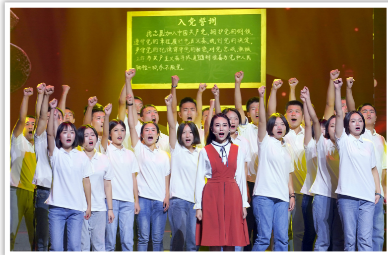
2019年9月5日，“向祖国报告”首都大学生庆祝中华人民共和国成立70周年诗诵会在北京大学举行。图为演员表演情景诗朗诵《入党申请书》

第三，要正确认识我国的基本国情和国际环境。正确的历史观、大局观、角色观是我们判断国情、审时度势的重要前提。随着“落后的社会生产”从总体上一去不复返，我国社会主要矛盾也发生了深刻的变化。尽管我国取得了前所未有的发展成就，但仍要客观地认识到，我国仍处于并将长期处于社会主义初级阶段的基本国情没有变，我国是世界上最大发展中国家的国际地位没有变。只有准确认识和把握