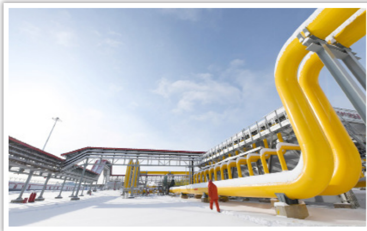
2019年12月2日，中俄东线天然气管道北段工程正式投产通气，开启两国能源合作新时代。图为中俄东线天然气管道北段黑河首站场区的管线

正确认识中国，正确认识世界。”中国愿同美国一道努力，在互惠互利基础上拓展合作，在相互尊重基础上管控分歧，推进以协调、合作、稳定为基调的中美关系，