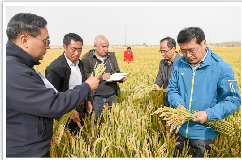
2019年10月24日,专家组成员在新疆喀什地区岳普湖县巴依阿瓦提乡为海水稻测产

亿亩。如果推广种植一亿亩海水稻,平均产量达到300公斤,一年内就能增产300亿公斤粮食,相当于湖南省一年的粮食总产量,可以多养活8000万人口。海水稻的研究是一项世界级的超级工程,不仅让中国