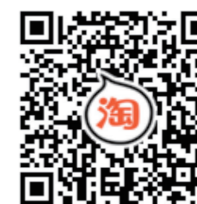
手机淘宝扫码进入订阅页面

声明： 在编写本刊过程中，我们摘编了部分网站、报刊的资料和专家观点，有的已联系并特别说明，对此我们深表感谢。同时，仍有少部分资料、图片的作者未能联系上，烦请这些作者见到本刊后与我们联系，以便支付稿酬。