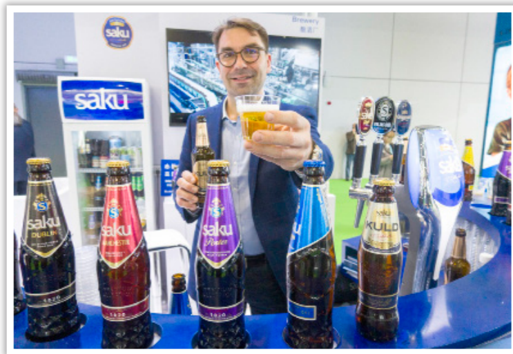
2019 年 11 月 7 日，在第二届中国国际进口博览会食品及农产品展区，一名工作人员展示来自爱沙尼亚的啤酒

“一带一路”国际合作高峰论坛、中国国际进口博览会、中非合作论坛、中国—东盟博览会、亚洲基础设施投资银行、上海合作组织、亚洲文明对话大会等；主办亚信上海峰会、APEC 北京峰会、二十国集团领导人杭州峰会、金砖国家领