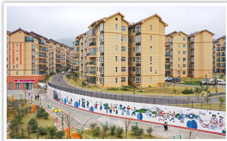
2019 年 12 月 23 日，贵州省全面完成 188 万人易地扶贫搬迁。图为 2019 年 12 月 19 日，航拍贵州省兴义市易地扶贫搬迁安置区洒金街道

农村贫困人口大幅减少。按现行农村贫困标准，2013—2018 年我国农村减贫人数分别为 1650 万人、1232 万人、1442 万人、1240 万人、1289 万人、1386 万人，每年减贫人数均保持在 1200 万人以上。6 年来，农村已累计减贫 8239 万人，年均减贫 1373 万人，6 年累计减贫幅度达到 83.2%，农村贫困发生率也从 2012 年年末的 10.2% 下降到 2018 年年末的 1.7%，其中，10 个省份的农村贫困发生率已降至 1.0% 以下。全国 832 个贫困县有 436 个宣布摘帽，全国 12.8 万个贫困村