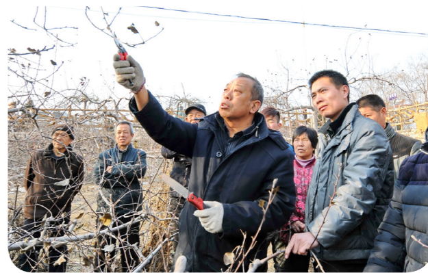
2016年1月27日，李保国（前左）在河北省邢台市 内丘县岗底村向村民讲解果树修剪知识

李保国教授很“牛”。他是著作 等身的博士生导师，是全国优秀共产 党员、全国优秀教师、时代楷模，科 研成果累计应用面积1826万亩，让 140万亩荒山披绿，使山区增收35.3 亿元，带动10万多农民脱贫致富， 成为党员干部眼中的“牛人”、太行 山百姓心中的“财神”。